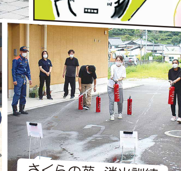
さくらの苑 消火訓練