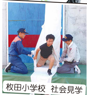
枚田小学校 社会見学