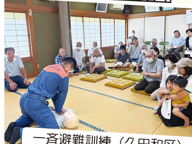
一斉避難訓練 (久田和区)