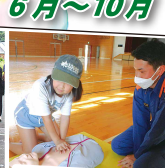
一斉避難訓練（高柳区）