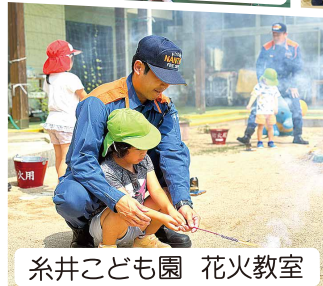
糸井こども園 花火教室