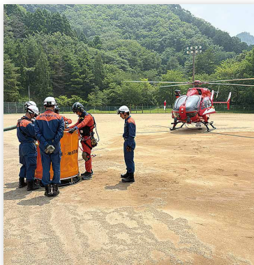
▲バケットへの給水

林野火災対応訓練では、消防隊の消火活動だけでは消火が極めて困難な林野火災が発生したとの想定で、航空隊と情報共有を行い、航空隊が所有するバケット(空中用消火バケツ)に消防隊が給水し、給水したバケツを装着した防災ヘリが上空から散水を行いました。