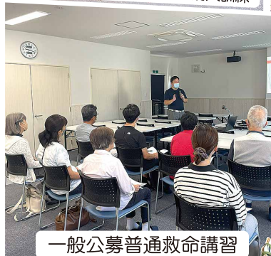
一般公募普通救命講習