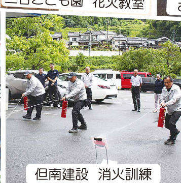
但南建設 消火訓練