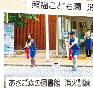
あさご森の図書館 消火訓練