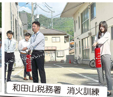
和田山税務署 消火訓練