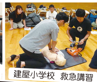
建屋小学校 救急講習