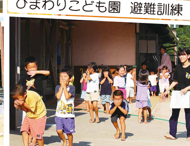
消火訓練 & 避難訓練