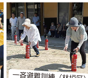
一斉避難訓練（林垣区）