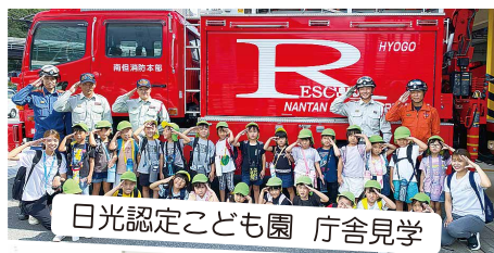
日光認定こども園 庁舎見学