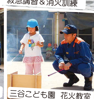
三谷こども園 花火教室