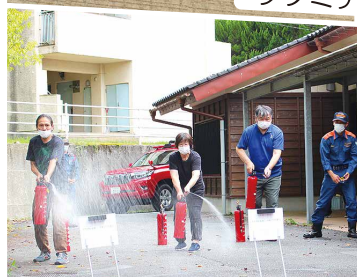
福祉村合同訓練 わらしべ消火訓練