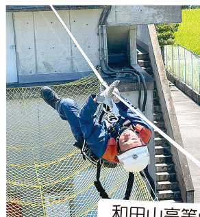
和田山高等学校 就業体験