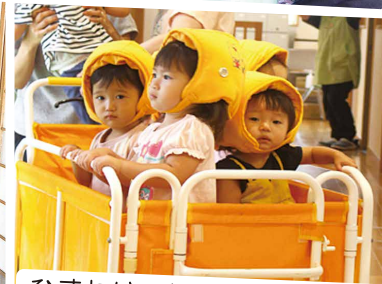
ひまわりこども園 避難訓練