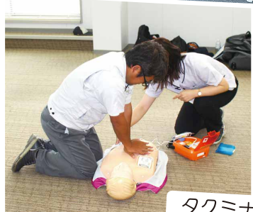
タクミナ 救急講習&消火訓練