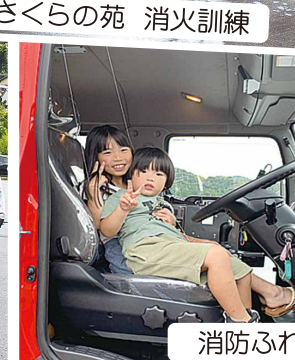
消防ふれあいまつり