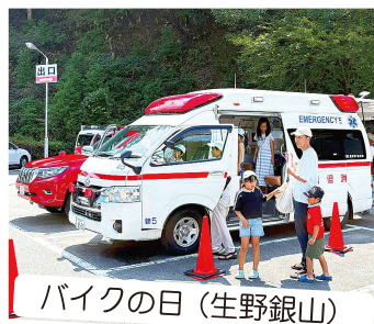
バイクの日 (生野銀山)