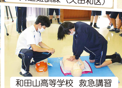
和田山高等学校 救急講習