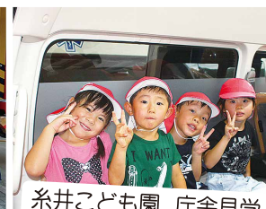
糸井こども園 庁舎見学